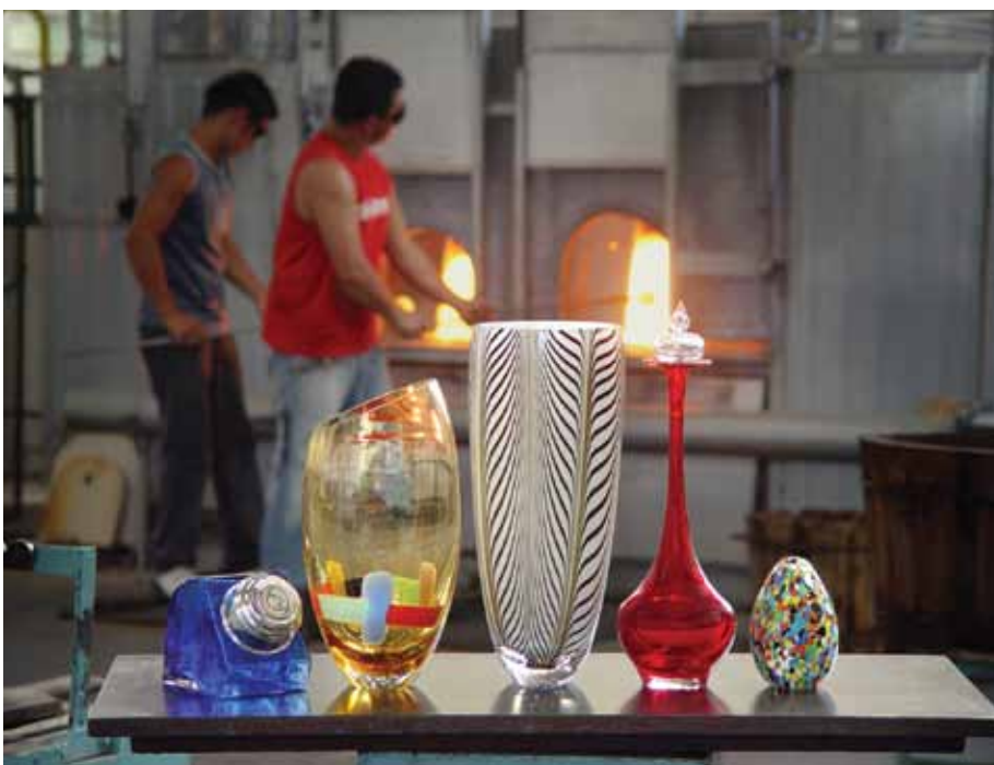
Cá D'oro preza pela qualidade de seus produtos

ção artesanal, baseada nas técnicas dos antigos vidreiros de Egito e Fenícia, nunca deixou de fazer parte das raízes da Cá D'oro.