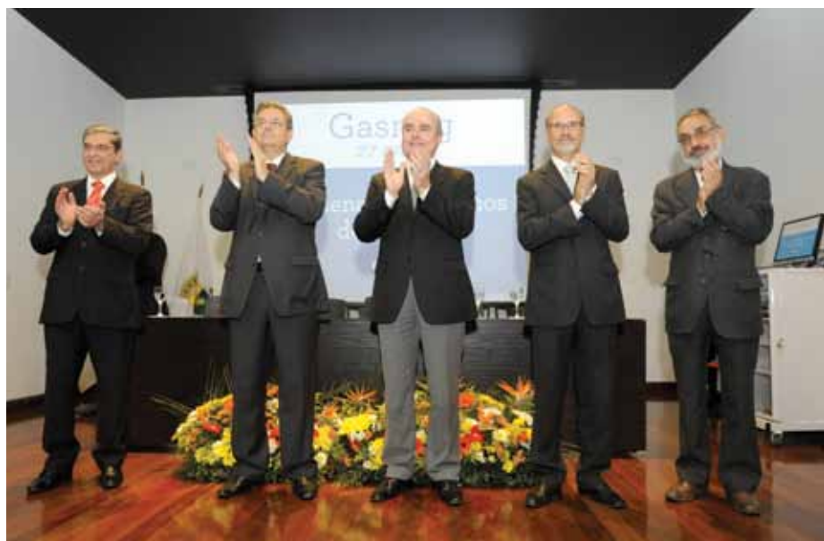
Lideranças da Gasmig participaram da confraternização